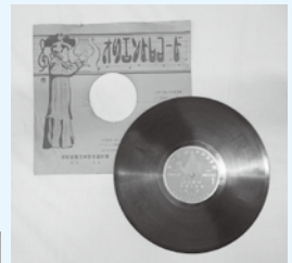
司法大臣尾崎行雄演説レコード