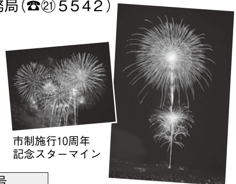
市制施行10周年記念スターマイン

今年の花火大会では、全国の花火師たちが技を競い合うとともに、伊勢市制施行10周年を記念したスターマインの放揚も行われました。花火大会の受賞者は次のとおりです。