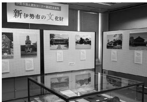
郷土資料コーナーでの展示

「筋活講座」 健康課(☎②435) 筋力を鍛え、いつまでも活 動的に過ごせる体づくりを シニア世代のための